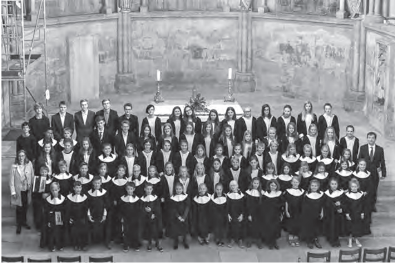
Naumburger Domsingschule im Westchor des Domes, September 2017

Am Sonnabend, dem 21. Oktober , gestalten die Mitglieder des Jugendchores der Domsingschule gemeinsam mit dem Domkammerorchester und dem Nachwuchsorchester der Musikschule Clarina ihr nächstes Konzertprojekt in der Marienkirche am Dom.