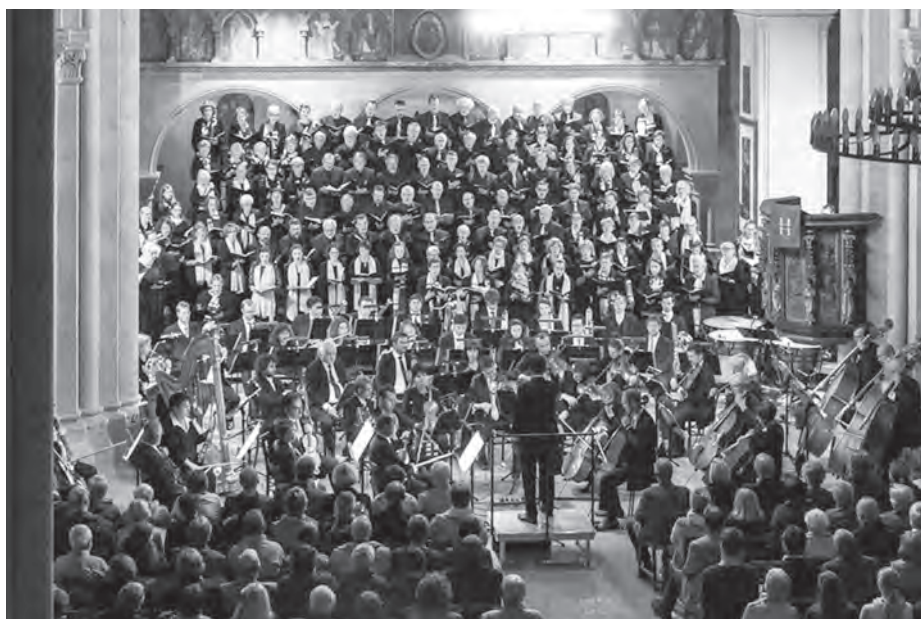
Konzert im Naumburger Dom 9.9.2017

Im nächsten Jahr findet die fruchtbare Kooperation der beiden Domchöre im Rahmen des traditionellen Kirschkonzertes mit der Aufführung des „Lobgesang“ von Felix Mendelssohn Bartholdy eine Fortsetzung.