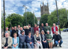
Besuch in Worcester 2022

Vom 20. bis 22. Mai 2023 erwartet unsere Gemeinde Besuch von englischen Pfarrerinnen und Pfarrern der Diözese Worcester in England, einer Partnerkirche unserer Landeskirche. Im Rahmen eines Partnerschaftsbesuches