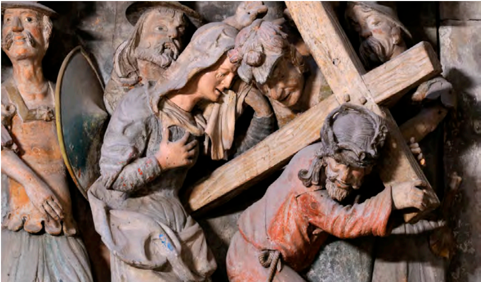
Relief vom Westlettner