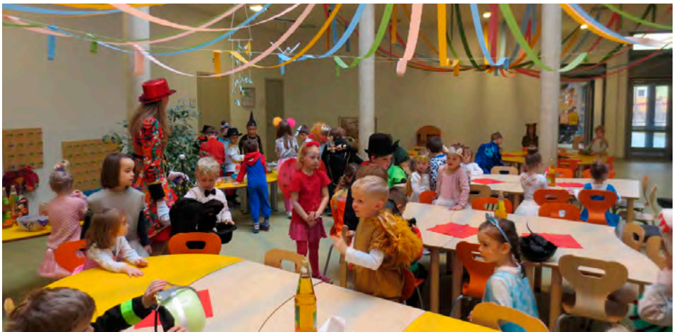
Faschingsfeier im Kindergarten