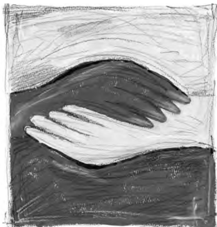
Grafik: Sieben Wochen Ohne