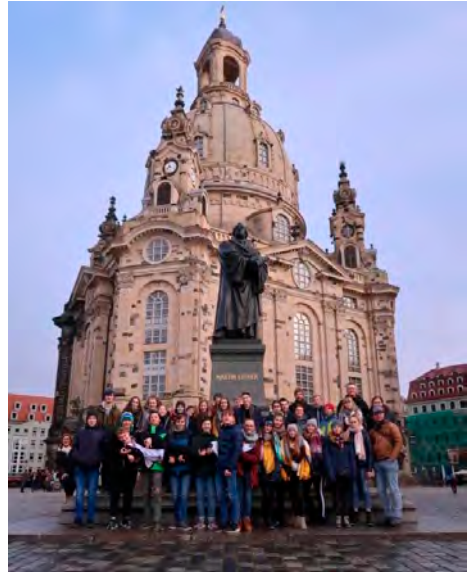
Die Konfirmanden in Dresden

Ein herzlicher Dank für den langen Atem, die Geduld und Kraft der vielen Helfer.