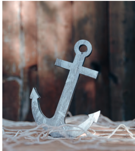
N. Schwarz © GemeindebriefDruckerei.de